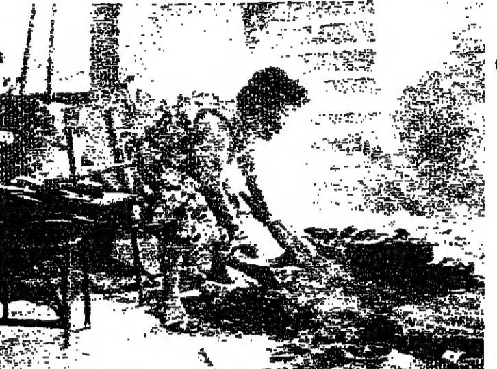
سيدة تتكلم من منزلها للتحدث في بيروت الغربية بعد عودتها إليه